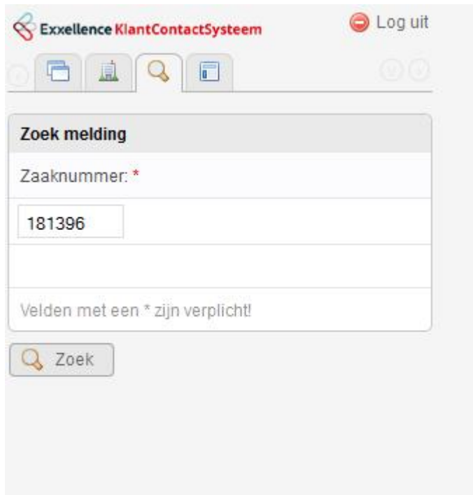
Figuur 5 KCS mobiel: Zoeken zaak

De zoek functie, zoals die in Figuur 5 is weergegeven, wordt niet aangepast.