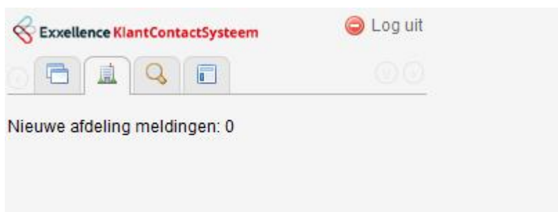
Figuur 2 KCS mobiel: werkvoorraad afdeling