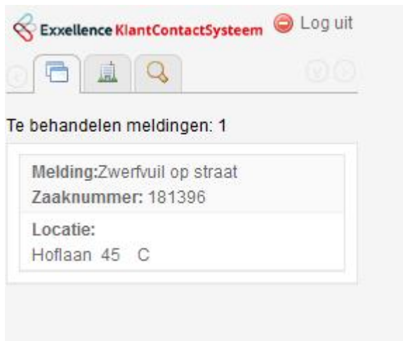
Figuur 1 KCS mobiel: Werkvoorraad